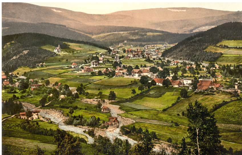
Karpacz ok. 1900 r.