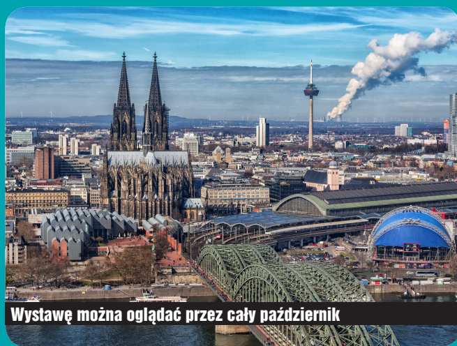
Wystawę można oglądać przez cały październik

Kolonia słynie z wielu cennych zabytków, a w szczególności z gotyckiej katedry i wielkich kościołów romańskich. Ważne są jej muzea i życie kulturalne. Żyje się tutaj w tradycji, a jednocześnie i w nowoczesności – rozwinięta gospodarka, media, tereny wystawowe. To największe miasto w kraju związkowym Nadrenia Północna-Westfalia, ma ok miliona mieszkańców. (ZK)