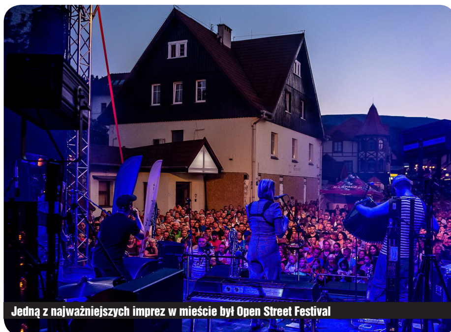
Jedną z najważniejszych imprez w mieście był Open Street Festival

W latach 2014-2018 zrealizowaliśmy kampanie w mediach ogólnopolskich. Ofertę zimową i letnią Karpacza promowaliśmy w telewizji, radiu i prasie. Ważniejsze projekty to: Strefa Kibica Eurosportu, „Zima TVN”, „Start do Nart” z Radiem ZET; „Pol-sat - bezpieczna zima z GOPR”, „Okrasa łamie przepisy”, czy wskazania sponsor-skie w radiu ESKA. Promowaliśmy się wykorzystując media społecznościowe poprzez takie inicjatywy jak „Zostań ambasadorem Karpacza (w tym miejscu dziękuję wszystkim Mieszkańcom za zaangażowanie)”, „Zasiedź się w Karpaczu” czy „Biorę Karpacz na tapetę”. Uczestniczyliśmy w targach turystycznych w Łodzi oraz w projekcie „Zimowy Narodowy”. Skutecznym narzędziem, biorąc pod uwagę sukcesy naszych saneczkarzy i bobsleistów, był także sponsoring sportowy. Markę Karpacza i jego wizerunek jako ważnego partnera gospodarczego budowaliśmy poprzez udział w Forum Ekonomicznym czy Samorządowym. Byliśmy gospodarzem takich wydarzeń jak: Forum Przemysłowe czy Konferencja „Wall Street”, kampanii infor-