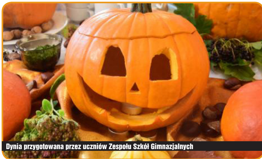
Dyńka przygotowana przez uczniów Zespołu Szkół Gimnazjalnych