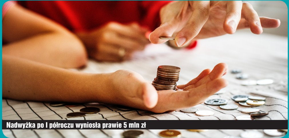
Nadwyżka po I półroczu wyniosła prawie 5 mln zł

Ważnym źródłem dochodów miasta są również opłaty (targowa, skarbowe) – z ich tytułu do budżetu wpłynęło 1,35 mln zł. Dochody z majątku Gminy wyniosły 1,39 mln zł,