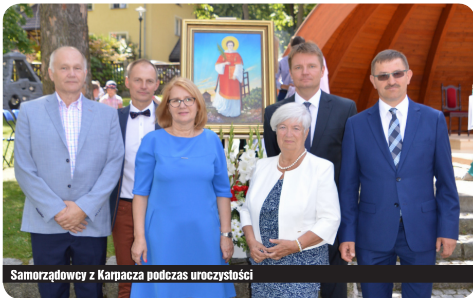
Samorządowcy z Karpacza podczas uroczystości