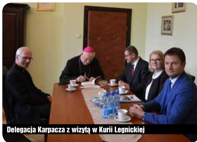
Delegacja Karpacza z wizytą w Kurii Legnickiej

Dekret zatwierdzający wybór patrona wydaje watykańska Kongregacja ds. Kultu Bożego i Dyscypliny Sakramentów. Taki dokument ma moc bulli papieskiej. Po otrzymaniu dekretu Rada Miejska Karpacza będzie mogła podjąć uchwałę promulgującą fakt ustanowienia patrona z podaniem w jej treści daty uroczystego ogłoszenia św. Wawrzyńca Patronem naszego Miasta, a także daty dorocznych obchodów dni patrona.