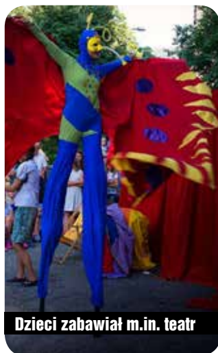
Dzieci zabawiał m.in. teatr

Lato w Karpaczu upłynęło pod znakiem rodzinnych imprez. Referat Promocji i Rozwoju zorganizował m.in. cykl spotkań Parkowanie pod Lipą, których finał odbył się w sobotę 29 lipca. Miejski park zamienił się wówczas w PARK sztuki – dzieci mogły bezpłatnie wziąć udział w warsztatach teatralnych, cyrkowych czy plastycznych, które okazały się doskonałą zabawą i prawdziwą gimnastyką dla ciała i umysłu! Uczestnicy zabawy mogli