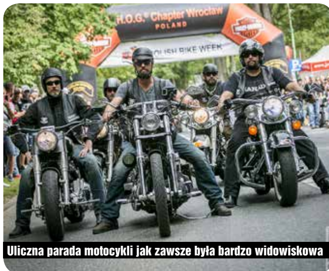
Uliczna parada motocykli jak zawsze była bardzo widowiskowa

Dużym zainteresowaniem cieszyły się złotowe konkursy, m.in. VI Mistrzostwa Polski Slow Ride, czyli w najwolniejszej jeździe motocyklem. Zawodnicy musieli jak najwolniej pokonać stumetrowy odcinek – startowali w parach, a zwyciężał oczywiście ten, który