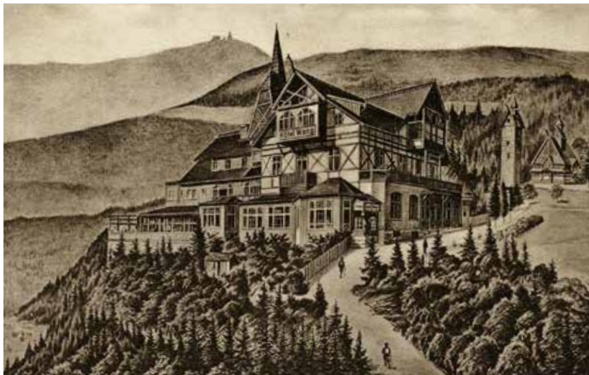
Hotel Wang w Karpaczu