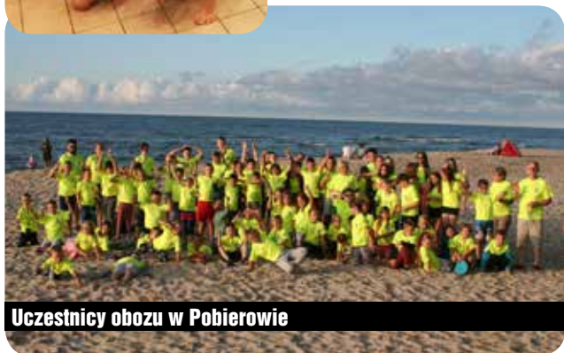
Uczestnicy obozu w Pobierowie