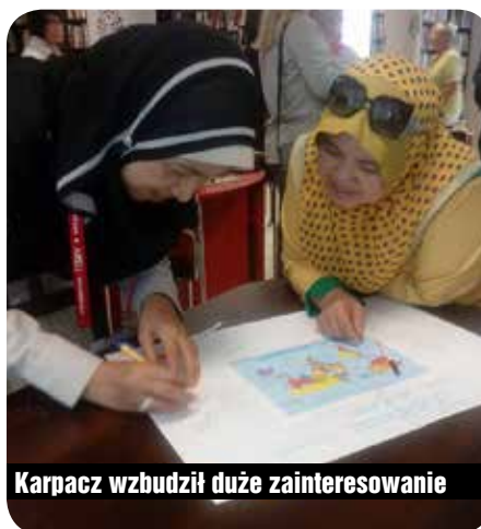
Karpacz wzbudził duże zainteresowanie

Do Karpacza przyjechało w sumie 45 uczestników IFLA, m.in. z Ghany, Ugan-