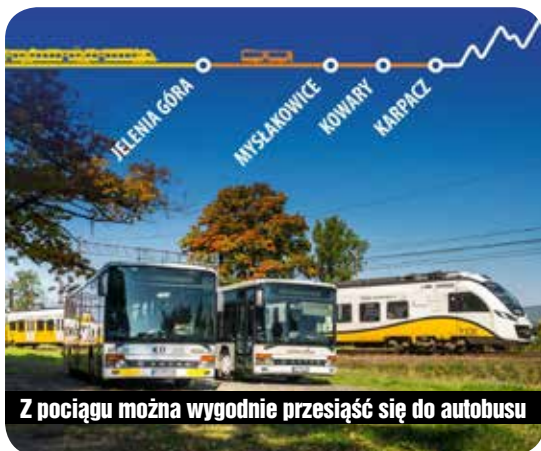
Z pociągu można wygodnie przesiąść się do autobusu