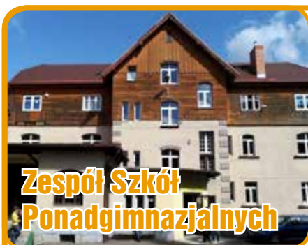
Zespół Szkół Ponadgimnazjalnych