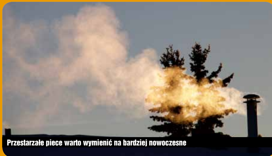
Przestarzałe piece warto wymienić na bardziej nowoczesne