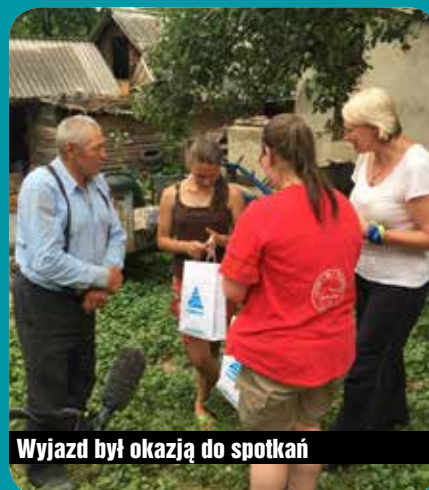
Wyjazd był okazją do spotkań