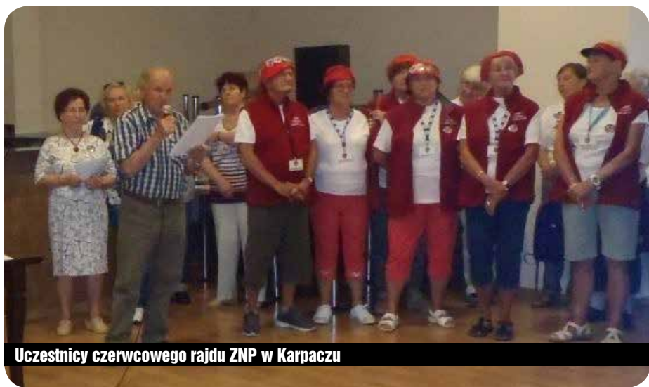
Uczestnicy czerwcowego rajdu ZNP w Karpaczu

W czasie obrad podkreślono również, że Dolnośląska Okręgowa Sekcja, do której należy nasza sekcja z Karpacza, istnieje już 55 lat. Wśród osiągnięć DOSEiR są m.in.: a) zwiększenie wpłat na fundusz „Senior”, z którego korzystają członkowie Związku znajdujący się w trudnej sytuacji materialnej (w ostatniej kadencji z „Seniora” skorzystało 5 osób z naszej sekcji); b) organizacja zbiorowych wyjazdów na wczasy i do sanatoriów. Z możliwości tej corocznie korzysta ok. 600 osób. Sekcja w Karpaczu organizuje co roku wyjazd nad morze – nie tylko dla członków, ale i mieszk