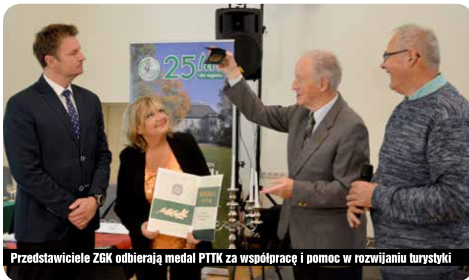
Przedstawiciele ZGK odbierają medal PTTK za współpracę i pomoc w rozwijaniu turystyki

Od ćwierćwiecza ZGK konsekwentnie wychowuje nowe pokolenie, by dbać o środowisko naturalne. Czyste Karkonosze – program obejmujący całą społeczność lokalną – wspierają finansowo Fundusz Ochrony Środowiska i starostwo powiatowe. Licząc z inwestycjami kwota sięga 60 mln euro i wraz ze środkami własnymi Związku stanowi poważne obciążenie budżetów gmin.