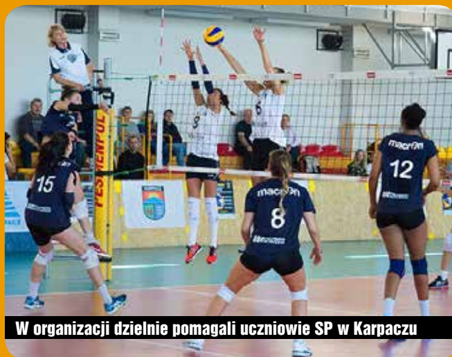
W organizacji dzielnie pomagali uczniowie SP w Karpaczu

W zawodach rozgrywanych w hali Szkoły Podstawowej w Karpaczu wzięły udział mistrzynie Niemiec z SC Schweriner, trzeci zespół Orlen Ligi Developres Rzeszów, a także dwukrotnie zdobywczynię Pucharu Polski i Superpucharu Polski MKS Dąbrowa Górnicza oraz czterokrotnie mistrzynie naszego kraju – Polski Cukier Muszynianka Muszyna. W spotkaniach rozegranych w piątek, 31 września, rzeszowianki pokonały rywalki z Muszyny 3:2, a MKS okazał się