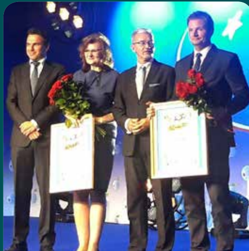
Nagrodę odebrał burmistrz miasta

Na Forum Ekonomicznym w Krynicy Karpacz został laureatem rankingu „Obywatelski Samorząd”, opracowanego przez Instytut Studiów Wschodnich oraz Centrum Gospodarcze im. Mikołaja Kopernika. W plebiscycie uczestniczyło 700 samorządów z całej Polski. Kapituła konkursu oceniała m.in. takie aspekty, jak wydatki na budżet obywatelski, współpracę z organizacjami pozarządowymi, częstotliwość spotkań z mieszkańcami, systemy informowania społeczności lokalnej. Nagrodę w obecności marszałka Senatu RP Stanisława Karczew-