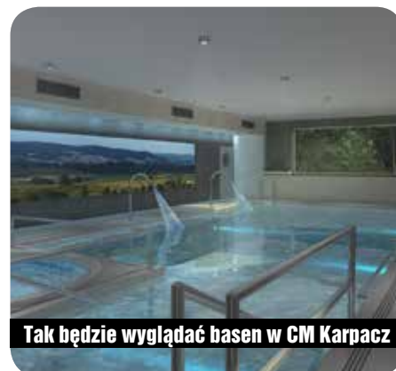
Tak będzie wyglądać basen w CM Karpacz

Warto też wspomnieć, że 11 września 2017 r. Centrum po raz kolejny uzyskało akredytację Ministra Zdrowia, która jest potwierdzeniem spełnienia przez szpital wysokich standardów. Z dniem 1 października CM Karpacz weszło do sieci szpitali.