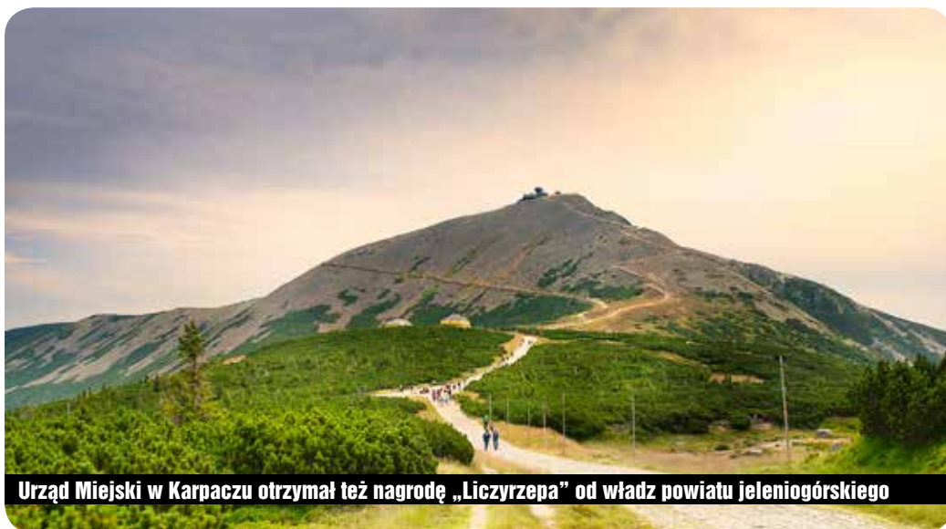
Urząd Miejski w Karpaczu otrzymał też nagrodę „Liczyrzepa” od władz powiatu jeleniogórskiego