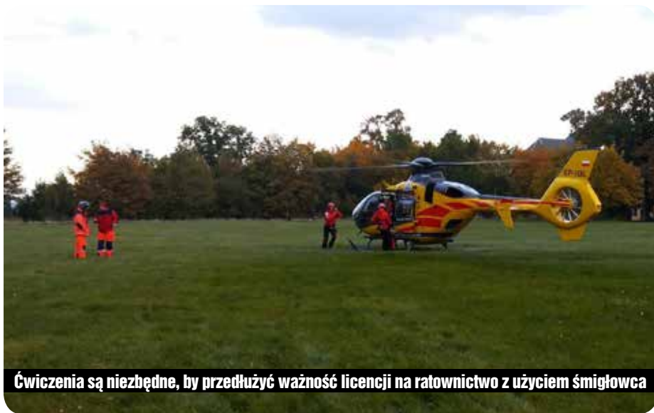
Ćwiczenia są niezbędne, by przedłużyć ważność licencji na ratownictwo z użyciem śmigłowca