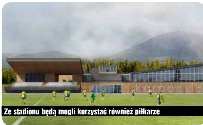
Ze stadionu będą mogli korzystać również piłkarze

Koszt całości inwestycji ma wynieść około 8 mln zł. Połowę potrzebnych środków ma