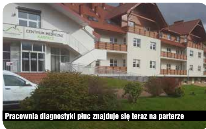
Pracownia diagnostyki płuc znajduje się teraz na parterze

W tym roku, podobnie jak w latach ubiegłych Centrum wzięło udział w Dniach Spirometrii, podczas których – już w nowej pracowni – odbyły się