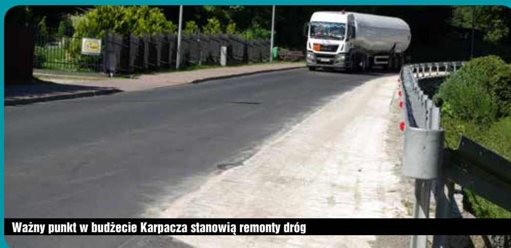
Ważny punkt w budżecie Karpacza stanowią remonty dróg

Jeśli chodzi o wydatki, przez pierwsze sześć miesięcy 2016 r. wyniosły one 16,1 mln zł, co