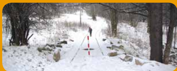
Fot. Anna Cirk-Dobiecka