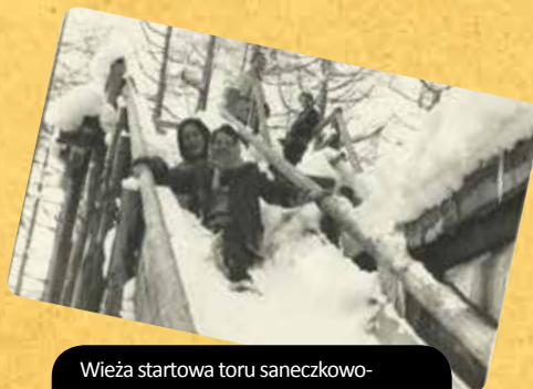
Wieża startowa toru saneczkowo-bobslejowego nad wodospadem (1954 r.)

więc propozycję przejścia do pracy w biurze turystycznym Juventur.