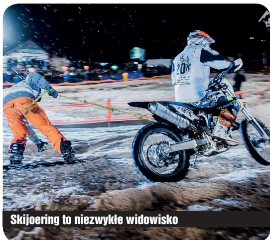
Skijoring to niezwykle widowisko