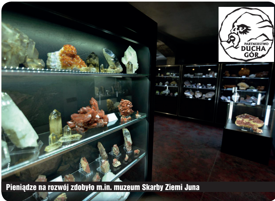
Pieniądze na rozwój zdobyło m.in. muzeum Skarby Ziemi Juna