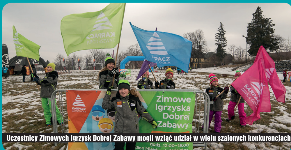
Uczestnicy Zimowych Igrzysk Dobrej Zabawy mogli wziąć udział w wielu szalonych konkurencjach godz. 12:00–15:00 dion Miejski, ul. Kościelna

W ramach Zimowych Igrzysk na Stadionie Miejskim urządzone olimpijskie miasteczko, pełne atrakcji dla całych rodzin. Za udział w szalonych konkurencjach dzieci otrzymywały pieczątki na specjalnych kuponach, które następnie można było wymienić na nagrody. Dorosli mogli stanąć do walki o tytuł mistrza m.in. w sprincie w butach narciarskich, skoku w dal na raketach śnieżnych czy saneczkarskich dwójkach. Dużą atrakcją były także przejażdżki konnym zaprzęgiem i bananem oraz warsztaty prowadzone przez Karkonoski Park Narodowy, Hutę Julię i Związek Gmin Karkonoskich.