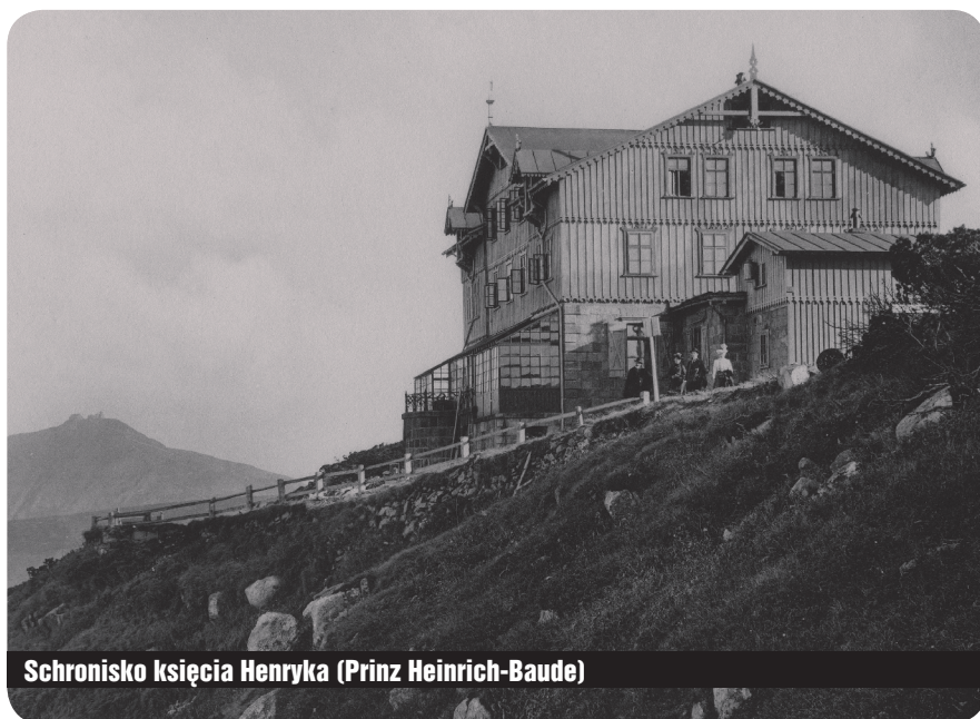
Schronisko Księcia Henryka (Prinz Heinrich-Baude)