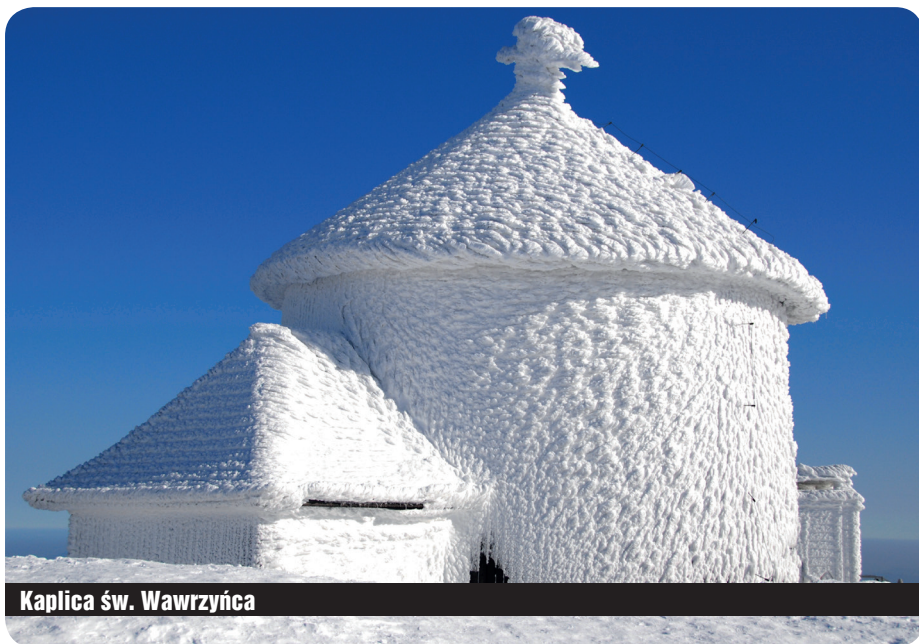
Kaplica św. Wawrzyńca