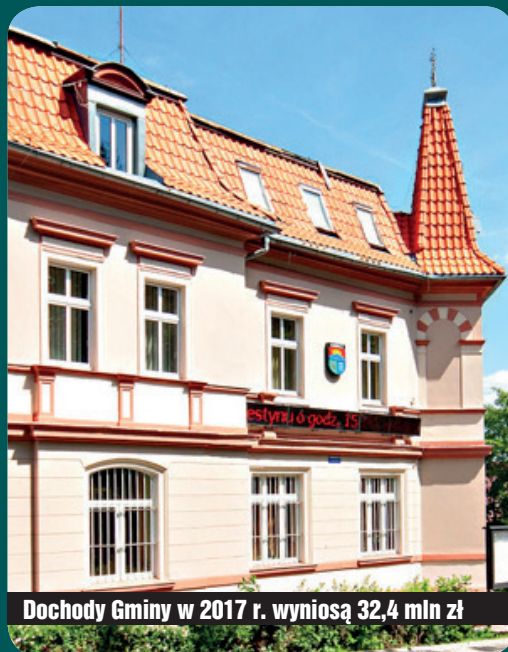
Dochody Gminy w 2017 r. wyniosą 32,4 mln zł

Po stronie dochodów zaplanowano m.in. wpływy z tytułu podatku od nieruchomości (11,2 mln zł), w tym podatek od osób fizycznych – 7,25 mln zł, a od osób prawnych – 3,93 mln zł. Dochody z podatku rolnego wyniosą 1980 zł, wpływy z podatku leśnego – 41,5