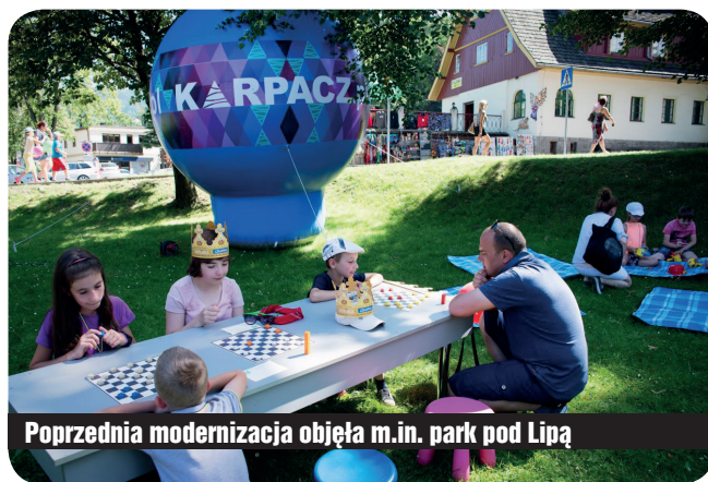
Poprzednia modernizacja objęła m.in. park pod Lipą