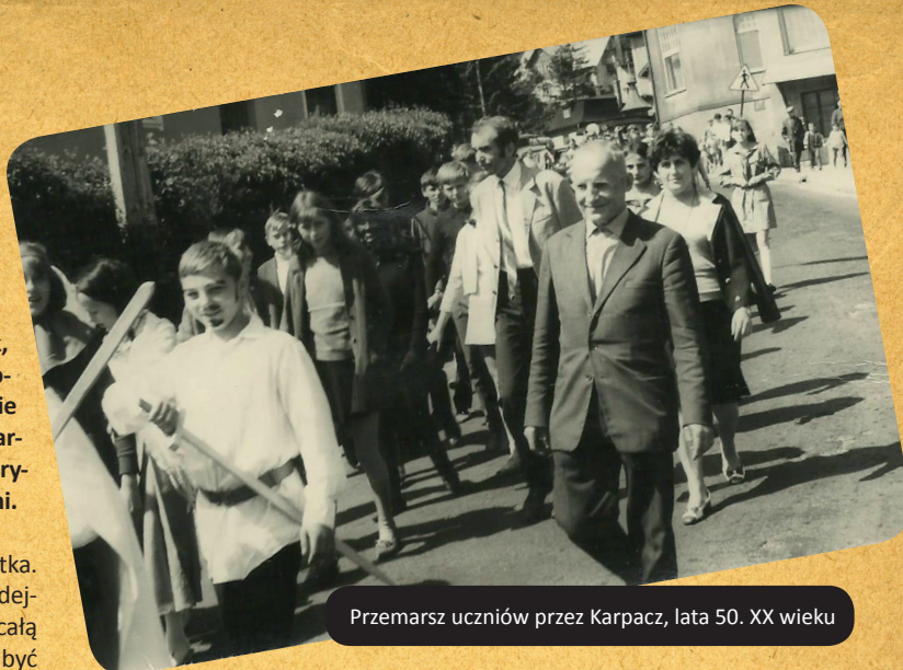
Przemarsz uczniów przez Karpacz, lata 50. XX wieku