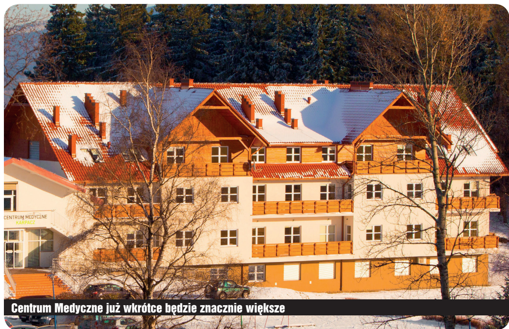
Centrum Medyczne już wkrótce będzie znacznie większe

Miniony rok był dla Centrum Medycznego Karpacz okresem umacniania oferowanych usług. Podjęto szereg działań, których nadrzędnym celem było ułatwienie mieszkańcom Karpacza dostępu do świadczeń.