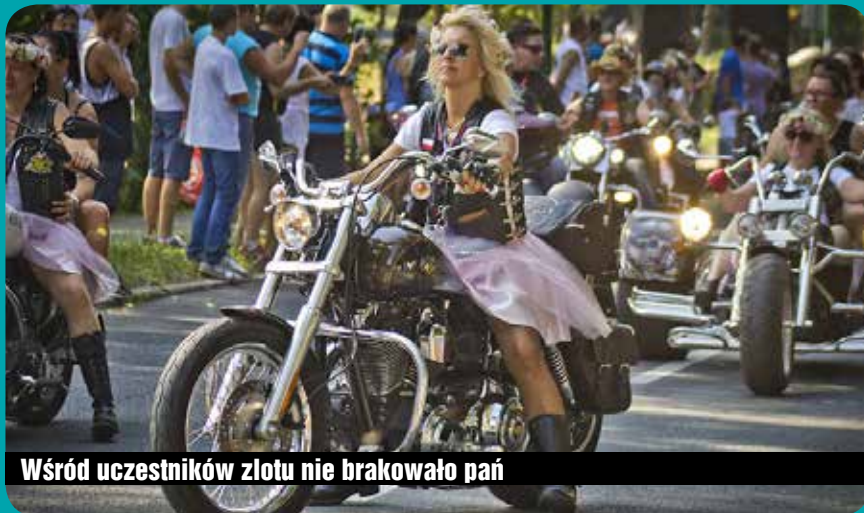
Wśród uczestników zlotu nie brakowało pań