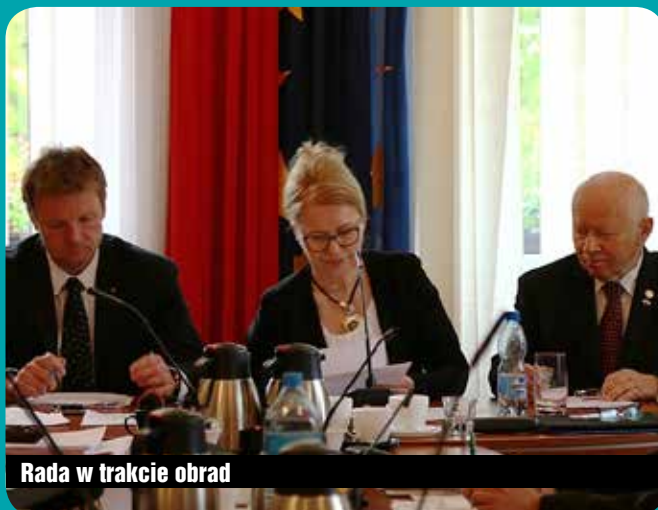
Rada w trakcie obrad

Z dokumentu wynika również, że mimo prowadzonej egzekucji na wysokim poziomie utrzymują się wymagalne należności budżetowe (4,2 mln