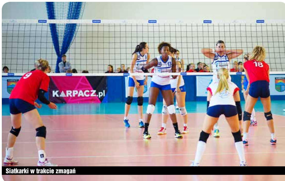
Siatkarki w trakcie zmagani