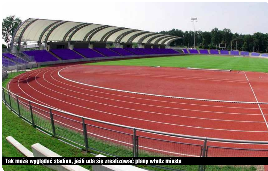
Tak może wyglądać stadion, jeśli uda się zrealizować plany władz miasta

wyniosą dochody Gminy Karpacz w 2015 r. po zmianach uchwalonych przez Radę Miejską