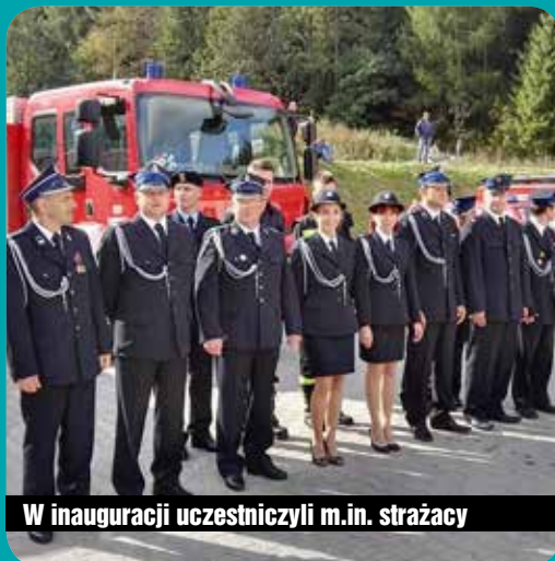
W inauguracji uczestniczyli m.in. strażacy

Nowe Centrum Zarządzania Kryzysowego w Karpaczu już działa! Koszt budowy placówki (wraz z wyposażeniem) przekroczy 7 mln zł, z czego 1,25 mln zł to środki z UE. Uruchomienie Centrum oznacza spore zmiany dla kilku instytucji z Karpacza. Przede wszystkim pod nowy adres przeprowadziła się Straż Pożarna. W Centrum swoje miejsce znajdują też Straż Miejska oraz wydział UM zajmujący się zarządzaniem kryzysowym. W budynku będą też urzędować pracownicy MZGK. (red.)