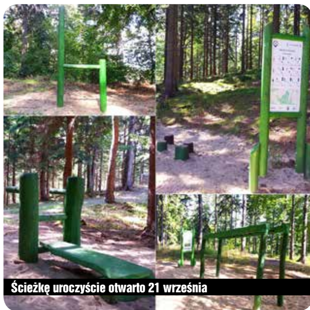
Ścieżkę uroczystie otwarto 21 września

Można już korzystać z nowego mini kompleksu sportowo-rekreacyjnego, stworzonego na górze Pohulanka w ramach programu „PZU Trasy Zdrowia”. Ścieżka wyposażona jest w 10 urządzeń do uprawiania sportu na świeżym powietrzu, które w dodatku postawiono w terenie o wyjątkowych walorach widokowych. Cała inwestycja warta jest ok. 50 tys. zł. Gmina otrzymała także grant w wysokości 5 tys. zł na organizację różnorodnych zajęć ruchowych z wykwalifikowanymi instruktorami. Biorą w nich udział osoby w każdym wie-