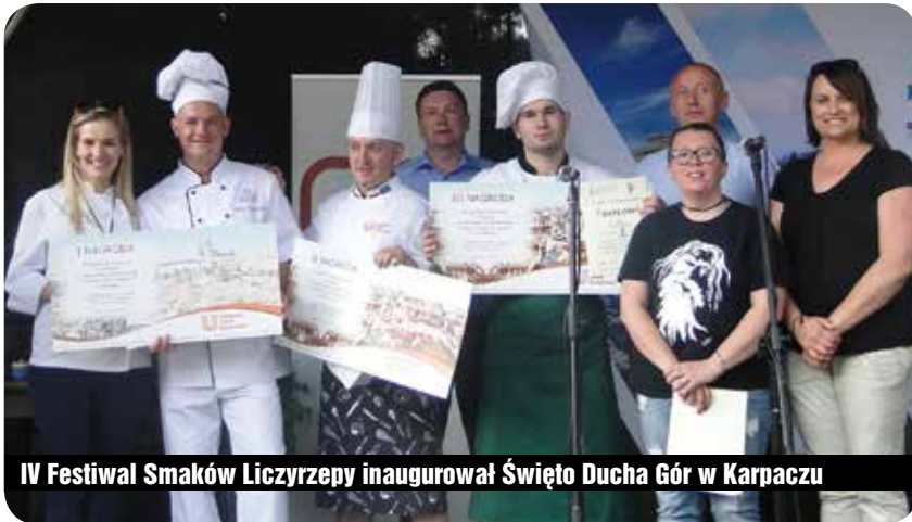
IV Festiwal Smaków Liczrzepy inaugurował Święto Ducha Gór w Karpaczu