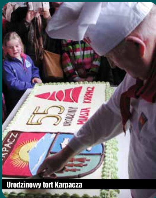
Urodzinowy tort Karpacza