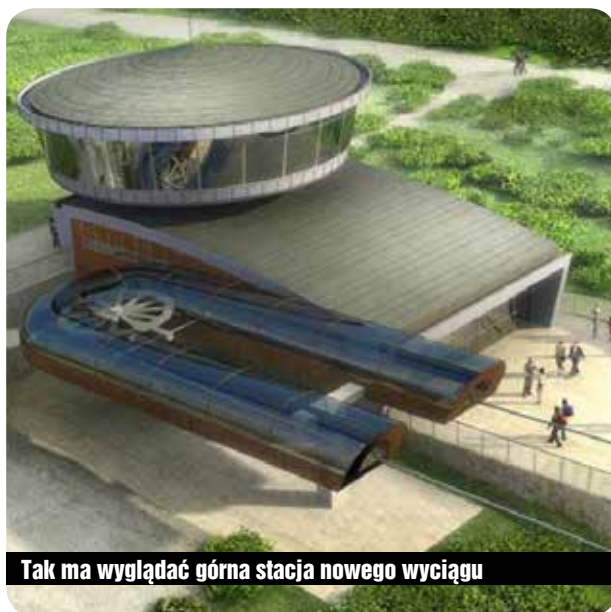
Tak ma wyglądać górna stacja nowego wyciągu

Na razie spółka szuka pieniędzy na inwestycję. Burmistrz Radosław Jęcek deklaruje, że prowadzi rozmowy z trzema innymi poważnymi inwestorami, którzy są zainteresowani działalnością na Kope. Nie wiadomo jednak, czy obecny właściciel MKL będzie gotów sprzedać wyciąg i czy strony dojdą do porozumienia w sprawie ceny. Pozwolenia na budowę posiadane przez spółkę są ważne jeszcze przez dwa lata. (red.)