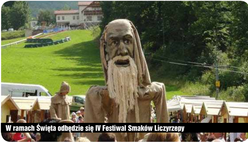
W ramach Święta odbędzie się IV Festiwal Smaków Liczyrzepy