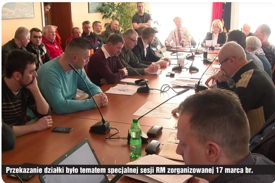
Przekazanie działki było tematem specjalnej sesji RM zorganizowanej 17 marca br.