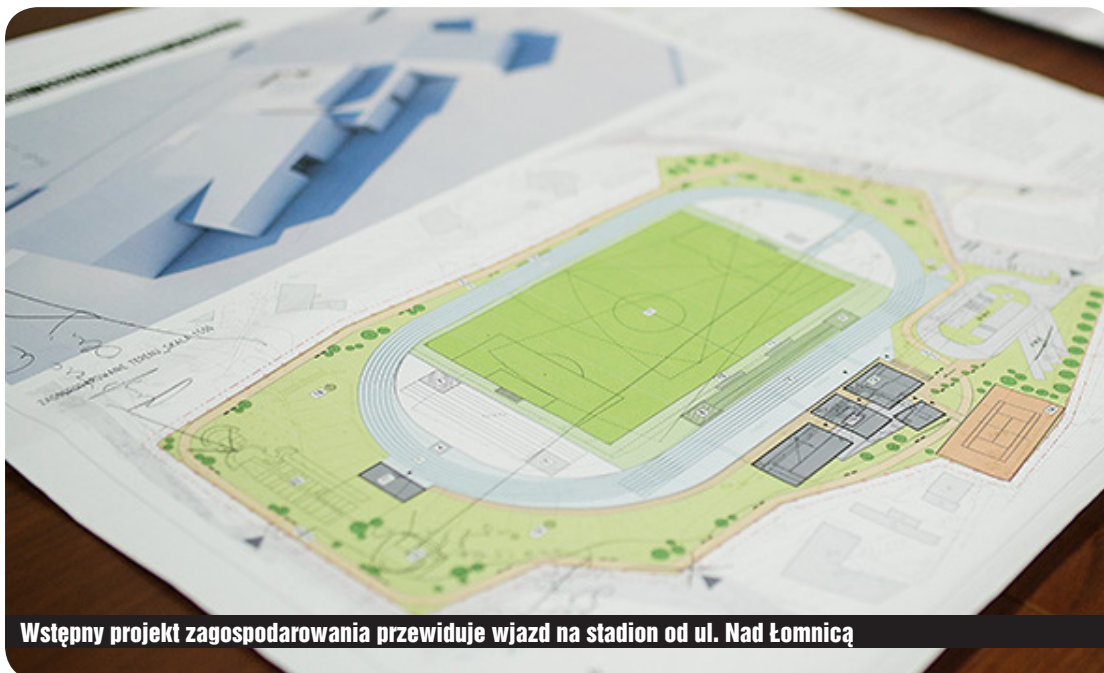
Wstępny projekt zagospodarowania przewiduje wjazd na stadion od ul. Nad Łomnicą