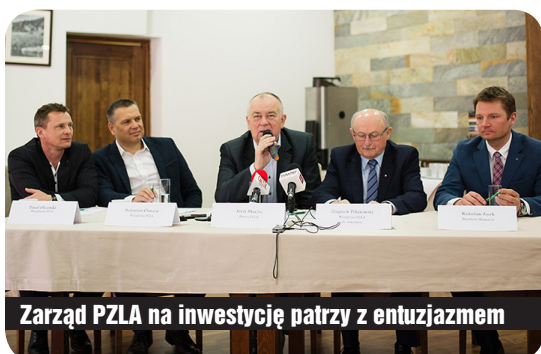
Zarząd PZLA na inwestycję patrzy z entuzjazmem

Burmistrz Karpacza ma nadzieję, że inwestycja ruszy w przyszłym roku, a pierwsi zawodnicy skorzystają z obiektu w roku 2018. Dokładny koszt budowy nie jest jeszcze znany. (red).