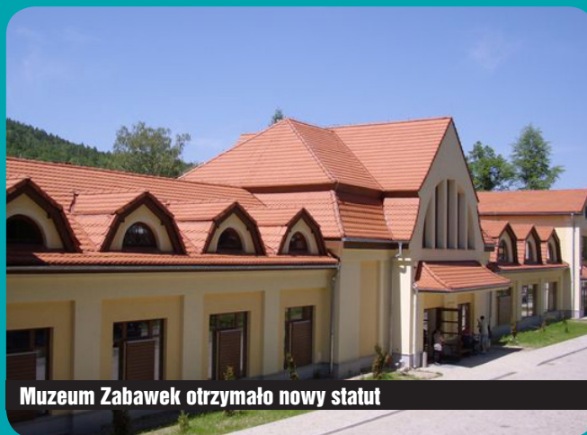
Muzeum Zabawek otrzymało nowy statut