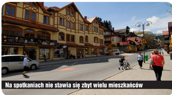
Na spotkaniach nie stawia się zbyt wielu mieszkańców

10 tysięcy spotkań z udziałem 180 tys. osób – tak przebiegały zakończone 22 kwietnia ogólnopolskie konsultacje w sprawie stworzenia krajowej mapy zagrożeń. To jeden z pomysłów Komendy Głównej Policji na poprawę bezpieczeństwa Polaków. Niestety, zainteresowanie obywateli akcją było niewielkie – jak łatwo policzyć, w każdym spotkaniu brało udział średnio 18 osób. W Karpaczu frekwencja była jeszcze niższa, na rozmowy z policjantami przychodziło po