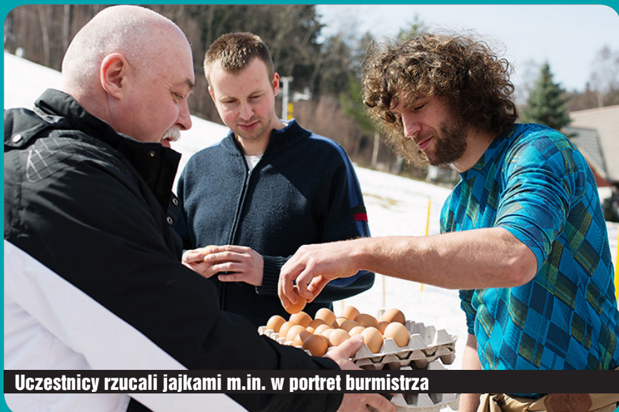
Uczestnicy rzucali jajkami m.in. w portret burmistrza