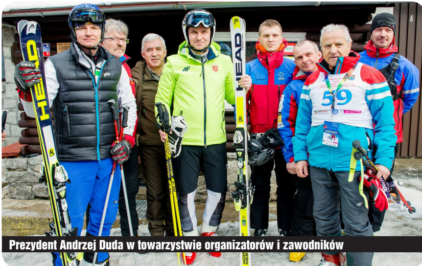
Prezydent Andrzej Duda w towarzystwie organizatorów i zawodników