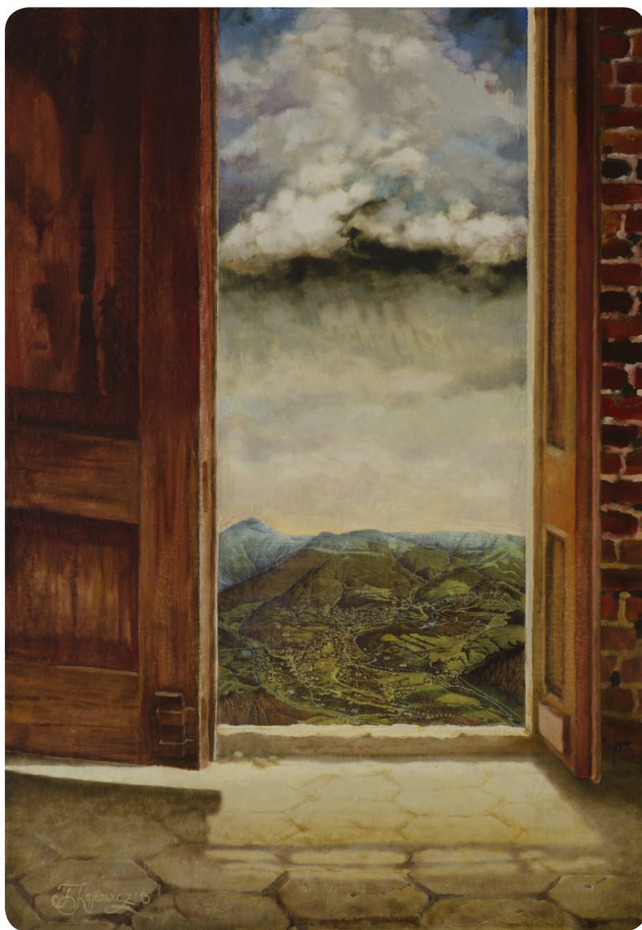
„Zaproszenie” Teresy Kępowicz - olej na płótnie, 2013

O malarstwie Teresy Kępowicz czytaj na str. 15