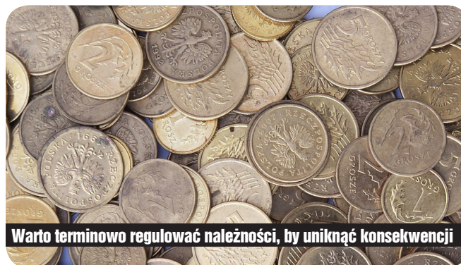
Warto terminowo regulować należności, by uniknąć konsekwencji

Informacje o zobowiązaniach dłużników z tytułu m.in. czynszów najmu lokali komunalnych, użytkowania wieczystego nieruchomości, dzierżawy gruntów, wykupu nieruchomości itp., zamieszczane będą w KR D BIG, co skutko-