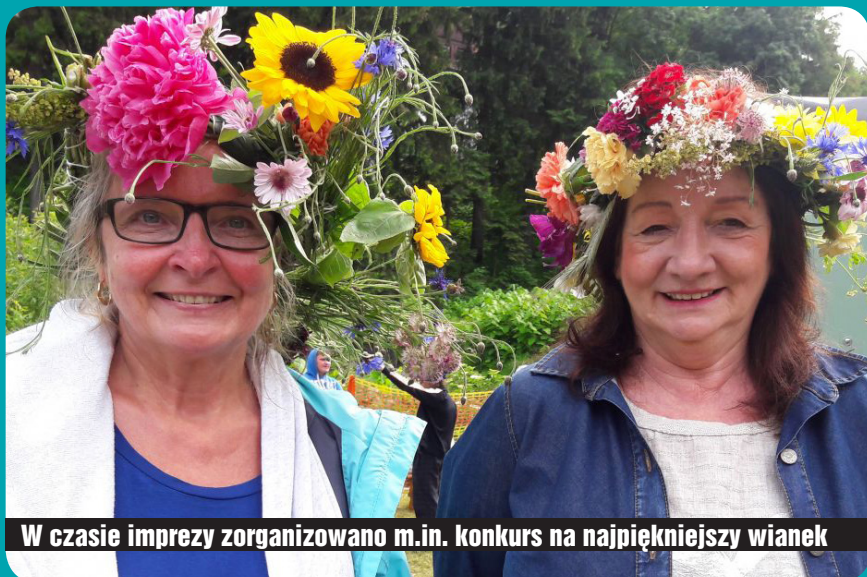
W czasie imprezy zorganizowano m.in. konkurs na najpiękniejszy wianek