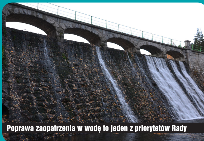
Poprawa zaopatrzenia w wodę to jeden z priorytetów Rady