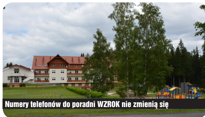
Numery telefonów do poradni WZROK nie zmienią się

Nowy sprzęt diagnostyczny to nie jedyna inwestycja Centrum. Z myślą o pacjentach