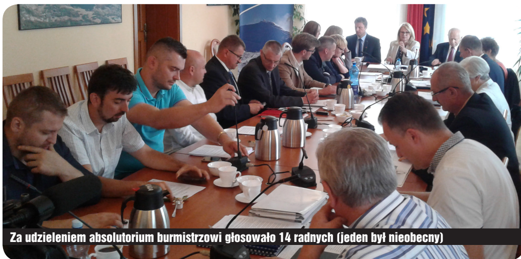
Za udzieleniem absolutorium burmistrzowi głosowało 14 radnych (jeden był nieobecny)