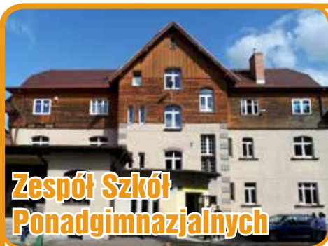
Zespół Szkół Ponadgimnazjalnych