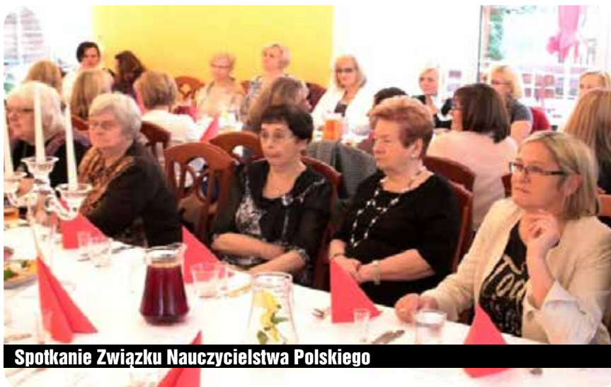
Spotkanie Związku Nauczycielstwa Polskiego