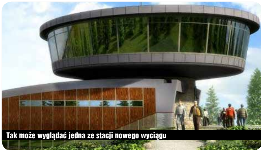
Tak może wyglądać jedna ze stacji nowego wyciągu