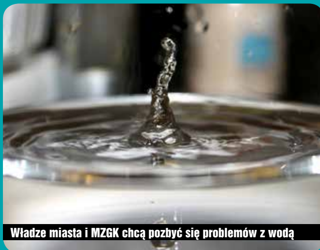
Władze miasta i MZGK chcą pozbyć się problemów z wodą

Drugi element planu to wykonanie zbiornika na wodę o pojemności 150 m 3 (przy ul. Komuny Paryskiej). Ta inwestycja kosztować będzie ok. 250 tys. zł, a jej realizację zaplanowano na lata 2016-2017.