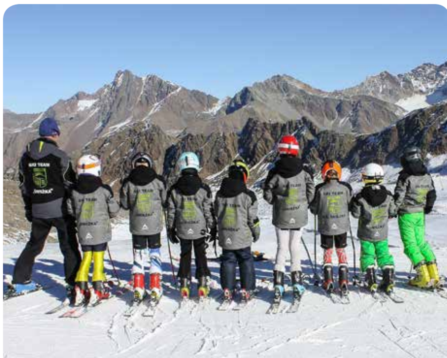
Tak prezentują się zawodnicy „Śnieżki” w kurtkach z herbem Karpacza