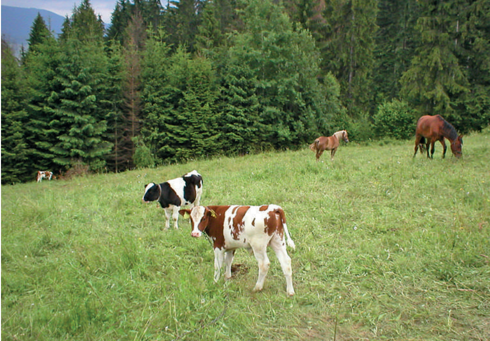
Fot. 8. Bydło i konie pozostawione bez nadzoru na leśnej polanie w Beskidzie Śląskim. Taki sposób wypasu zwiększa ryzyko ataku wilków