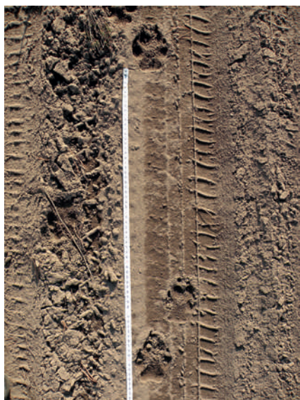
Fot. 5. Pomiar odległości pomiędzy tropami wilka