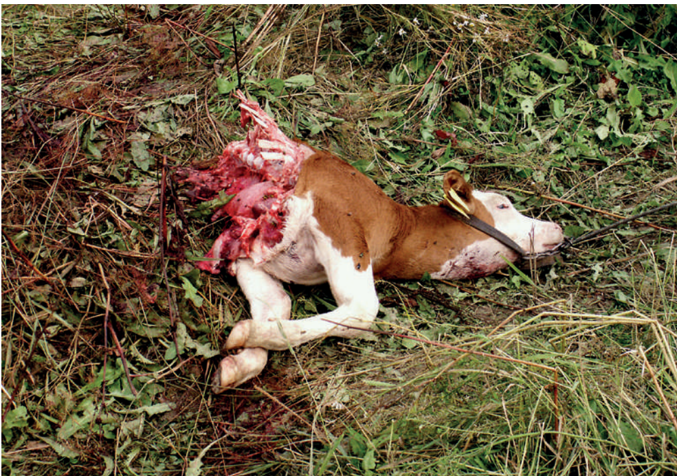
Fot. 9. Cielę zabite przez wilki w Beskidzie Śląskim. Zwierzęta wypasane na uwieży są łatwą zdobyczą dla drapieżników