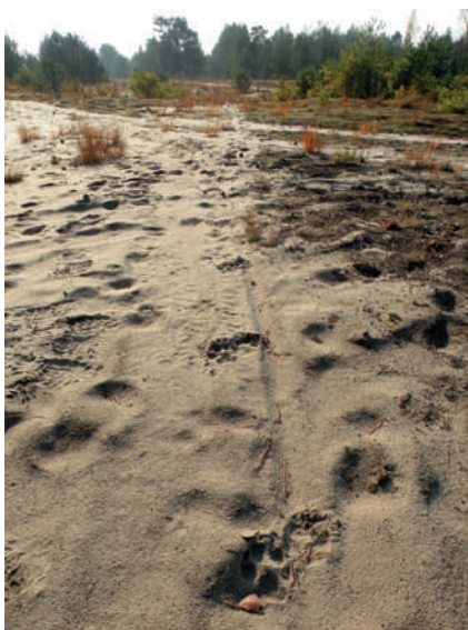
Fot. 6. Ciąg tropów wilka na drodze leśnej. Dokumentacja fotograficzna powinna obejmować także ujęcia tropów wraz z otoczeniem

a w konsekwencji do nieuznania szkody jako spowodowanej przez wilki. Zwierzęta ranne należy jak najszybciej zaopatrzyć weterynaryjnie.