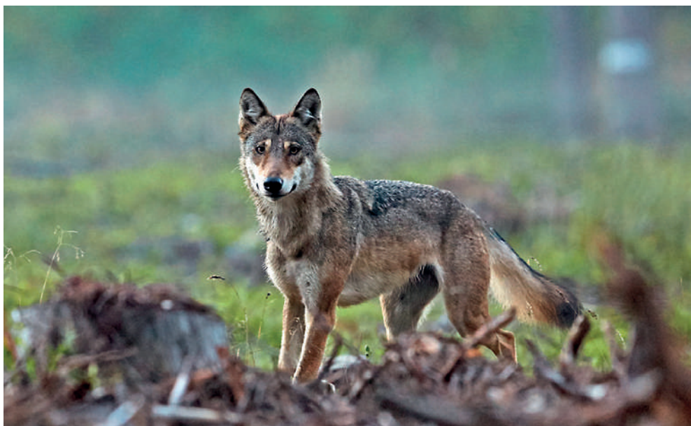
Fot. 2. Wilk w szacie letniej

dorosłych samców to około 40–45 kg, a samic średnio 35 kg. Wilki zamieszkujące Polskę mają najczęściej umaszczenie płowo-beżowe, z brązowo-czarnym grzbietem i mocno rudym tyłem uszu i głowy. Zdarzają się osobniki jaśniej ubarwione lub ciemniejsze (zawsze jednak tył głowy i uszu jest rudy), natomiast wilki jednolicie czarne lub białe w Polsce nie występują. Młode, niespełna roczne osobniki są ciemniejsze od dorosłych. W zimie wilki mają bardzo grubą i puszystą sierść (Fot. 1), latem jest ona znacznie cieńsza (Fot. 2). Sprawia to, że zimą wilki wydają się o wiele większe niż są w rzeczywistości.