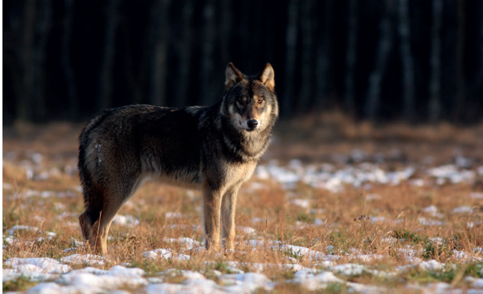
Fot. 1. Wilk w szacie zimowej

dorosłych samców to około 40–45 kg, a samic średnio 35 kg. Wilki zamieszkujące Polskę mają najczęściej umaszczenie płowo-beżowe, z brązowo-czarnym grzbietem i mocno rudym tyłem uszu i głowy. Zdarzają się osobniki jaśniej ubarwione lub ciemniejsze (zawsze jednak tył głowy i uszu jest rudy), natomiast wilki jednolicie czarne lub białe w Polsce nie występują. Młode, niespełna roczne osobniki są ciemniejsze od dorosłych. W zimie wilki mają bardzo grubą i puszystą sierść (Fot. 1), latem jest ona znacznie cieńsza (Fot. 2). Sprawia to, że zimą wilki wydają się o wiele większe niż są w rzeczywistości.