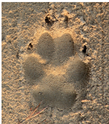
Fot. 3. Odbicie przedniej łapy wilka