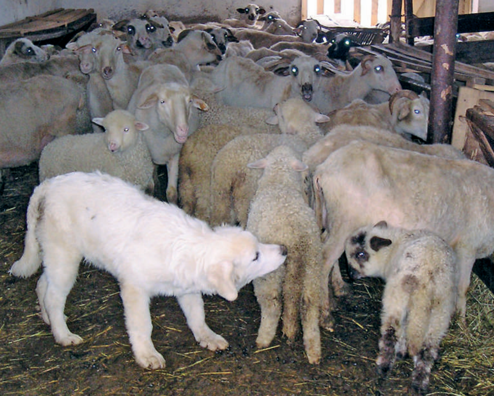
Fot. 12. Młody owczarek podhalański socjalizuje się ze stadem owiec w owczarni

chu poszczególnych osobników. Jak każdy młody pies, nasz owczarek będzie potrzebował sporo ruchu, dlatego codziennie trzeba wypuszczać go z kojca na pastwisko, aby się wybiegał.