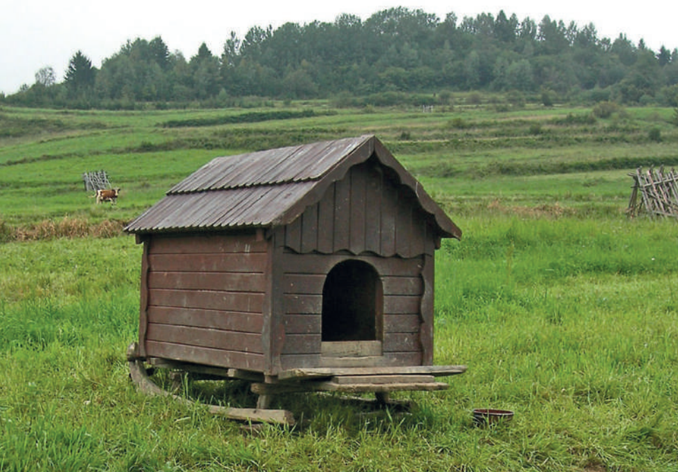
Fot. 13. Buda służąca za schronienie dla owczarka podhalańskiego na pastwisku w Beskidzie Śląskim. Posadowienie budy na płozach ułatwia jej transport

Owczarki podhalańskie mają długą sierść, która wymaga regularnej pielęgnacji, powinno się je zatem szczotkować raz w tygodniu. Dłuższe włosy za uszami i na łapach można rozczesać grzebieniem z metalowymi zębami. Owczarki linieją dwa razy w roku. W tym okresie zaleca się częstsze szczotkowanie psa. W trakcie pielęgnacji zwracać należy szczególną uwagę na wszelkie zmiany skórne, a także dokładnie sprawdzać uszy i oczy. Przy okazji warto skontrolować skórę psa pod kątem występowania pasożytów zewnętrznych.