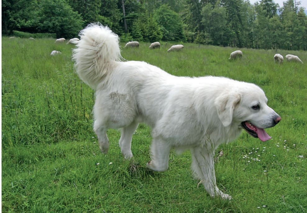
Fot. 10. Owczarek podhalański opiekujący się stadem owiec w Beskidzie Śląskim