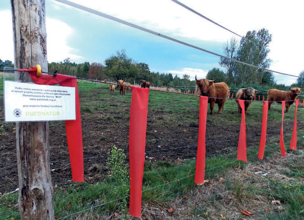
Fot. 15. Kombinacja pastucha elektrycznego i fladry chroniąca bydło w Borach Dolnośląskich

wysokości 70–75 cm nad ziemią. Pastuch składa się z trzech linek (ewentualnie taśm), najniższa linka wisi 15 cm nad gruntem (tam gdzie kończą się wstążki fladry), druga linka na tej samej wysokości co sznurek, do którego przyszyte są fladry, natomiast trzecia linka na wysokości 100 cm nad gruntem. Wyniki testów wskazują, iż jest to metoda 2–10 razy bardziej skuteczna niż fladry lub pastuch stosowane oddzielnie. Kombinację pastucha elektrycznego i fladry stosuje się też w zachodniej Polsce, do ochrony bydła i owiec (Fot. 15).