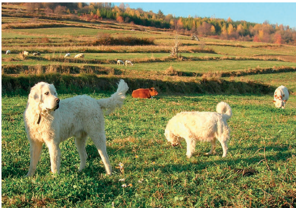
Fot. 11. Dwa owczarki podhalańskie pilnujące stada bydła w Beskidzie Śląskim