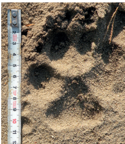
Fot. 4. Pomiar długości tropu wilka

Wilk to zwierzę palchochodne, chodząc opiera się tylko na czterech palcach, chronionych od spodu twardymi, zgrubiałymi poduszkami oraz na poduszce międzypalcowej, ustawionej za palcami. Trop dorosłego wilka jest duży (dł. 11–12 cm, szer. 9–10 cm), wydłużony i symetryczny (Fot. 3 i 4). Na końcach palców umiejscowione są pazury. Łapa przednia jest większa od tylnej o około 1 cm. Poduszka międzypalcowa przedniej łapy ma niewielkie sercowate wcięcie z tyłu. W łapie tylnej wcięcia brak.