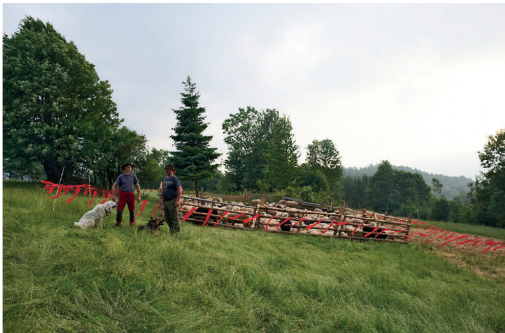
Fot 7. Połączenie opieki pasterzy, psów i fladry daje najlepsze efekty podczas wypasu owiec na górskich halach

Metody ochrony inwentarza dzielą się na dwie grupy. Do pierwszej zalicza się wykorzystywanie różnych gatunków zwierząt stróżujących. Spośród nich najbardziej rozpowszechnione są odpowiednie rasy psów. Druga grupa obejmuje najróżniejsze urządzenia techniczne i środki chemiczne: ogrodzenia siatkowe i elektryczne, fladry, odstraszenie dźwiękowe, świetlne i zapa-