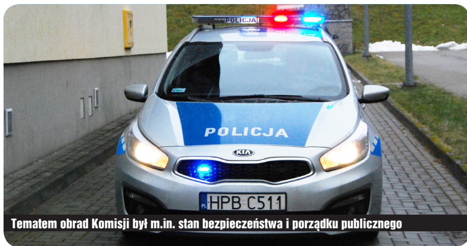
Tematem obrad Komisji był m.in. stan bezpieczeństwa i porządku publicznego