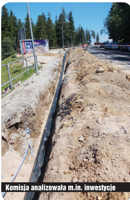
Komisja analizowała m.in. inwestycje

Rozpatrzyła przedłożone przez burmistrza Karpacza sprawozdanie finansowe Gminy za 2016 rok i sprawozdanie z wykonania budżetu Gminy Karpacz za 2016 rok oraz zapoznała się z uchwałą Komisji Rewizyjnej Rady Miejskiej Karpacza z dnia 5 czerwca 2017 r. w sprawie wniosku o udzielenie absolutorium burmistrzowi Karpacza za 2016 r.