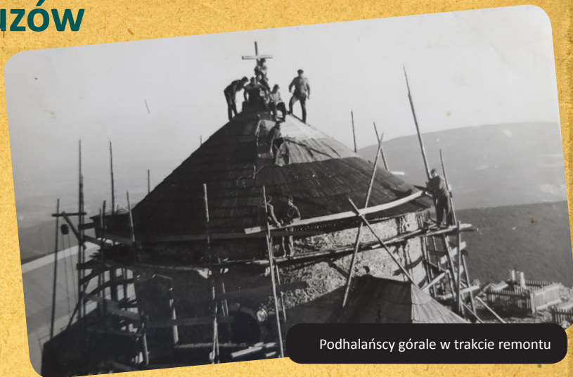
Podhalańscy górale w trakcie remontu

Fachowcy zgodzili się przyjechać, choć najpierw trzeba było co nieco