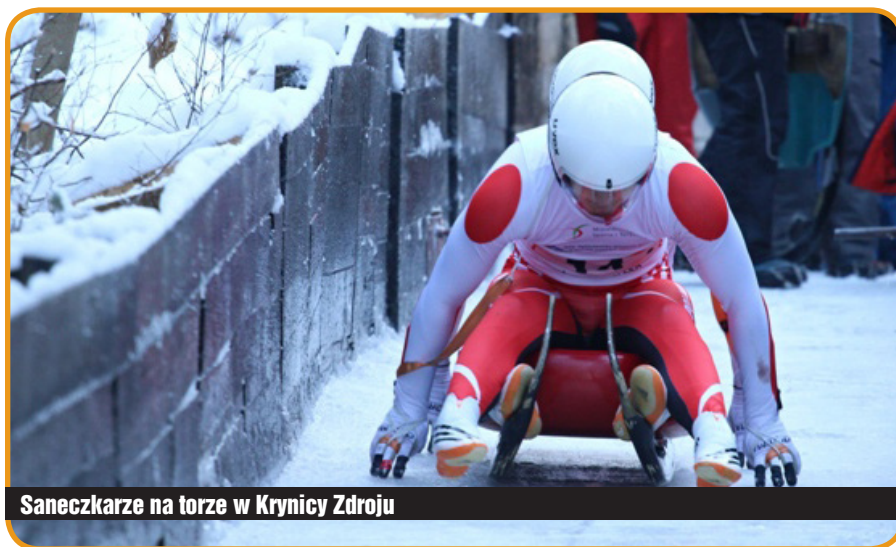
Saneczkarze na torze w Krynicy Zdroju