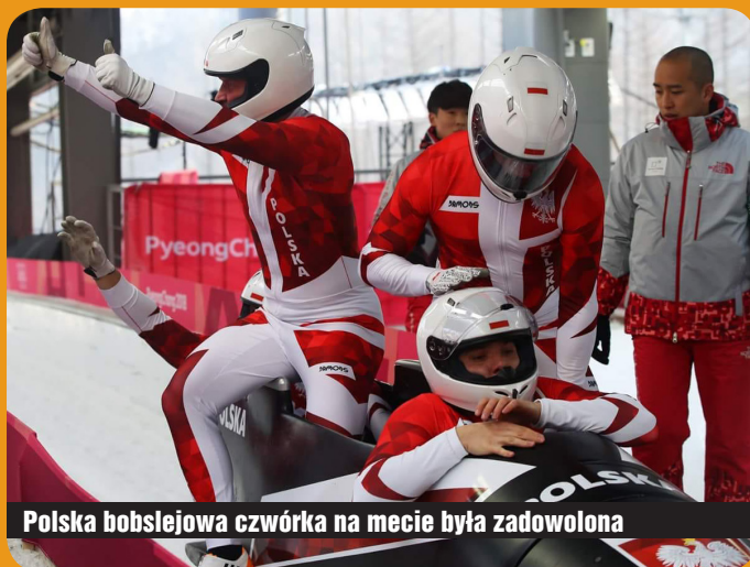
Polska bobslejowa czwórka na mecie była zadowolona