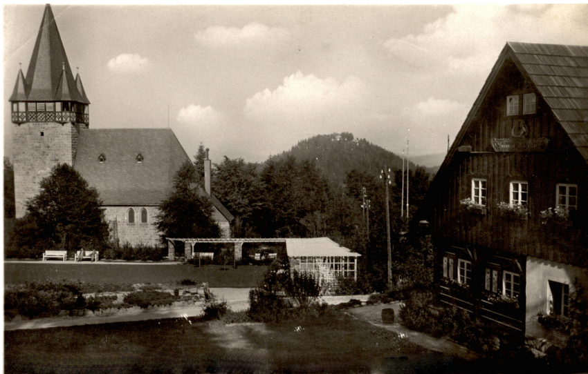
Budynki MSiT oraz kościoła Najświętszego Serca Pana Jezusa przed wojną