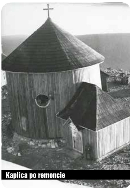
Kaplica po remoncie