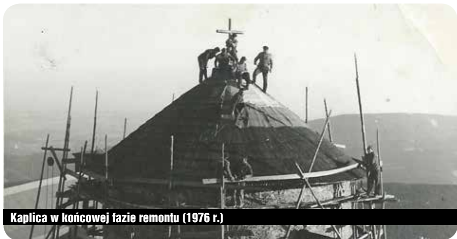
Kaplica w końcowej fazie remontu (1976 r.)

Kaplica jest pierwszym obiektem, który powstał na najwyższej górze Karkonoszy. Decyzję o budowie podjął Christian Leopold Schaffgotsch, aby zaznaczyć granicę swoich ziem i uczcić pamięć o ojcu Hansie Ulrichu, który popadł w cesarską niełaskę i w 1635 r. został stracony w Regensburgu. Początkowo granica między królestwem