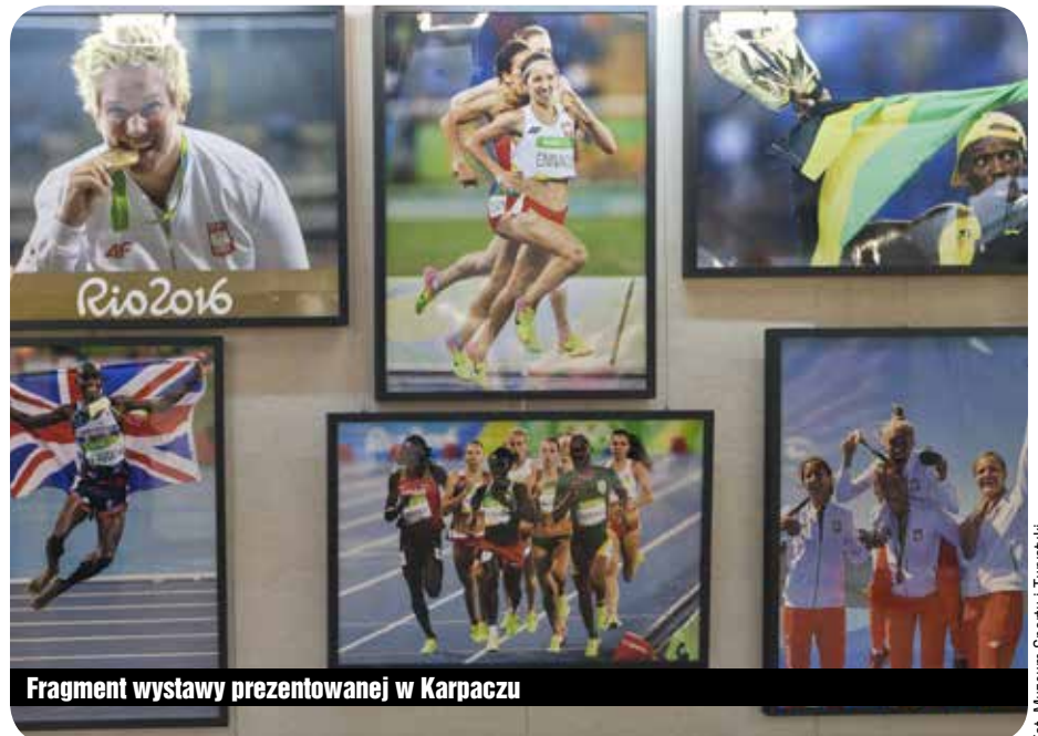
Fragment wystawy prezentowanej w Karpaczu

Po niej w muzeum eksponowana będzie nowa wystawa z Polskiego Komitetu Paraolimpijskiego, która pokazywać bę-