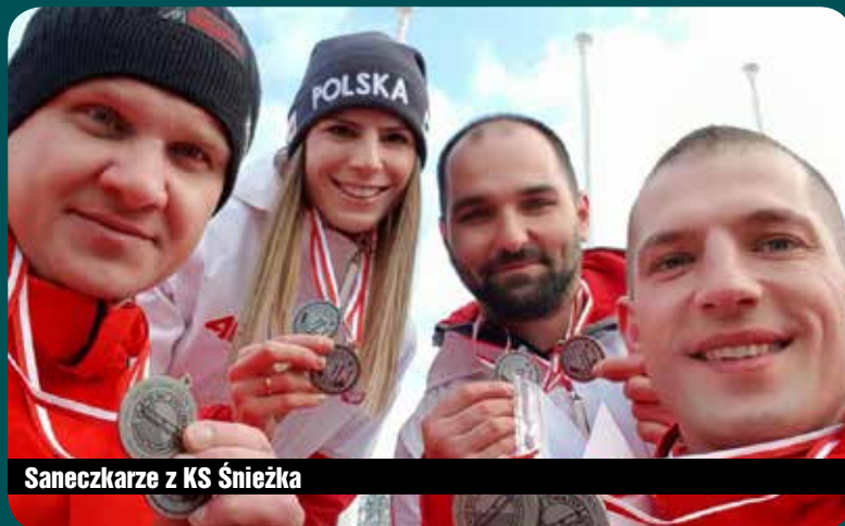
Saneczkarze z KS Śnieżka