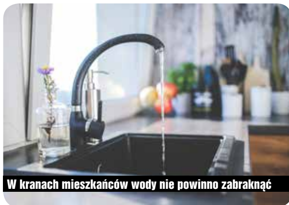
W kranach mieszkańców wody nie powinno zabraknąć

28 lutego br. Rada Miejska w Karpaczu przyjęła Wieloletni planu rozwoju i modernizacji urządzeń wodociągowych i urządzeń kanalizacyjnych na lata 2018-2021. Wśród tegorocznych zadań modernizacyjnych w dokumencie wymieniono m.in. budowę sieci wodociągowej R160 w ul. Dzikiej o długości 300 mb (koszt projektowany: 120 tys. zł), wymianę i budowę przyłączy wodociągowych i kanalizacyjnych w ul. Sikorskiego (154,9 tys. zł), budowę sieci wodociągowej R160 wraz z przyłączami w ul. Granitowej o długości 550 mb (243,7 tys. zł) oraz przebudowę sieci wodociągowej R125 w ul. Zacisznej o długości 250 mb (koszt projektowany: 30 tys. zł). Jeszcze w tym roku powstać ma też warta 40 tys. zł sieć wodociągowa przy Centrum Medycznym w Karpaczu. (RM)