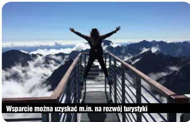
Wsparcie można uzyskać m.in. na rozwój turystyki

2. Rozwój działalności gospodarczej termin konkursu: 2.05.2018 r. – 16.05.2018 r. forma wsparcia: refundacja do 300.000 zł.