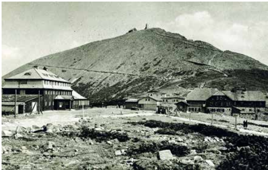
Widok na Śnieżkę