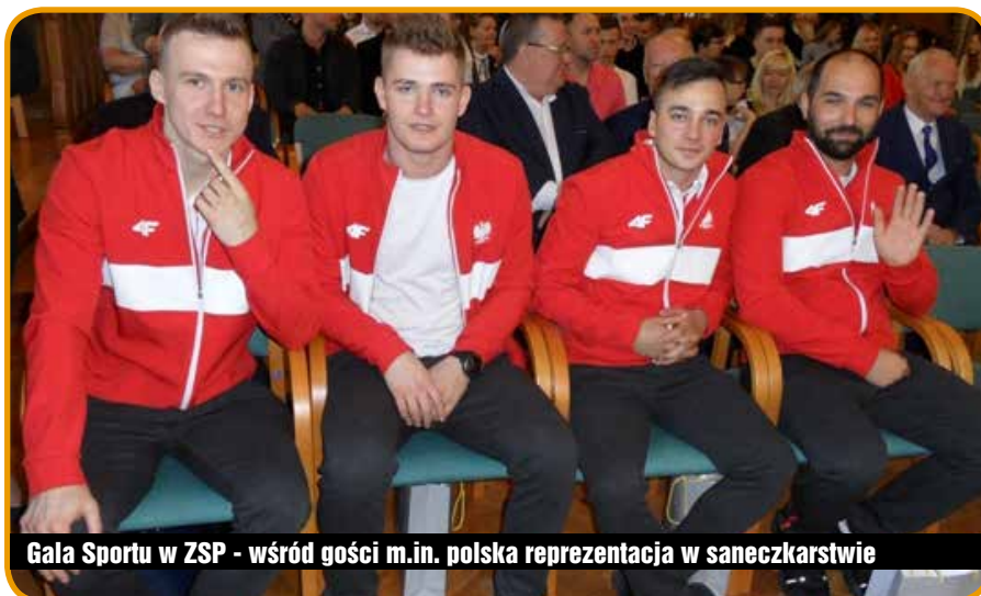
Gala Sportu w ZSP - wśród gości m.in. polska reprezentacja w saneczkarstwie