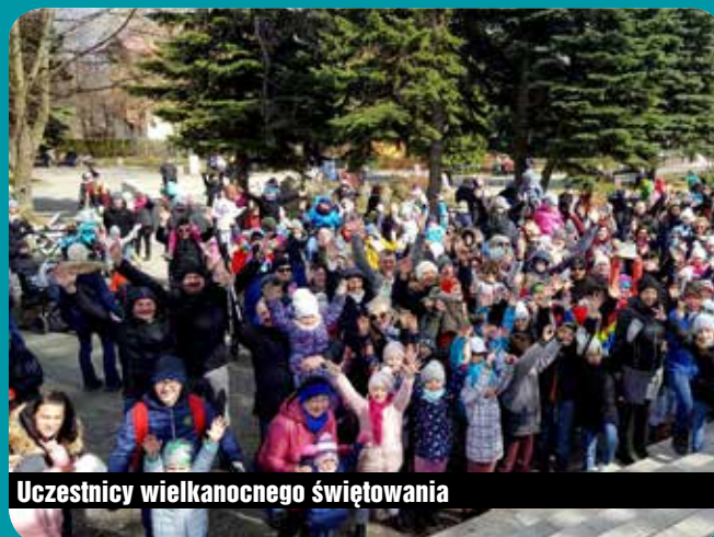
Uczestnicy wielkanocnego świętowania

W Lany Poniedziałek natomiast już po raz 18. spotkaliśmy się na Mistrzostwach Polski „z Jajem”. Na uczestników czekały nietypowe konkurencje, jak „Stalowe jajo” czy „Rzut jajem w portret Burmistrza”. Można też było skosztować GIGAJAJECZNICZY z 2018 jaj. Za organizację XVIII Mistrzostw Polski „z Jajem” Miasto dziękuje Karkonoskiej Organizacji Turystycznej oraz Towarzystwu Miłośników Karpacza. (prom)