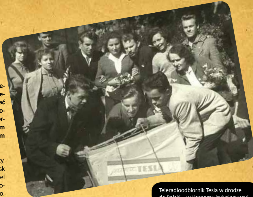
Teleradiodbiornik Tesla w drodze do Polski – w Karpaczu był pierwszy!

Ale orkiestra nie była jedynym projektem muzycznym mojego ojca. Na początku lat 50. został też dyrygentem chóru Zespołu Pieśni i Tańca, który powstał przy Okręgowym Zarządzie Funduszu Wczasów Pracowniczych (FWP) w Karpaczu. To do FWP należała wówczas spora część miejscowych domów wypoczynkowych.