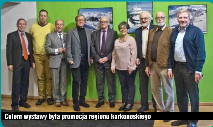
Celem wystawy była promocja regionu karkonoskiego