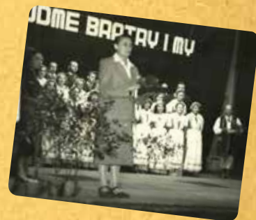
Zespół Pieśni i Tańca w Czechach – pod hasłem „Bądźmy braćmi i my!”

Orkiestra dęta działała w Karpaczu nawet wówczas, gdy zamiast sierot z Powstania do Karpacza zaczęto kierować dzieci ofiar wojny koreańskiej. Rozpadła się dopiero wtedy, gdy wojna w Azji wygasła – wówczas i dom dziecka przestał być potrzebny. A działania Zespołu Pieśni i Tańca przerwały przekształcenia w FWP pod koniec lat 60. Niestety, niczego podobnego już nigdy nie stworzono.