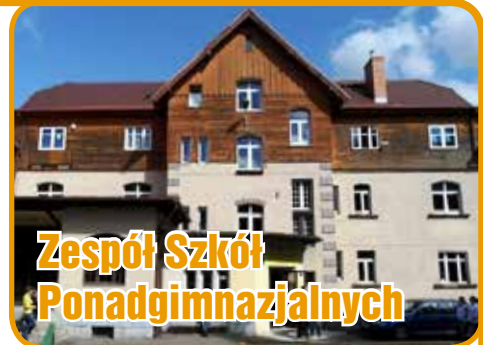
Zespół Szkół Ponadgimnazjalnych