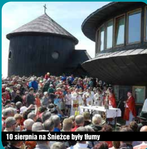
10 sierpnia na Śnieżce były tłumy

Dziś dzień ten jest świętem wszystkich ludzi gór. W tegorocznych uroczystościach uczestniczyło kilkaset osób, które po mszy modliły się w Kotle Łomniczki przy cmentarzu ofiar gór. (net)