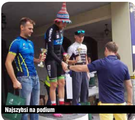
Najszybsi na podium