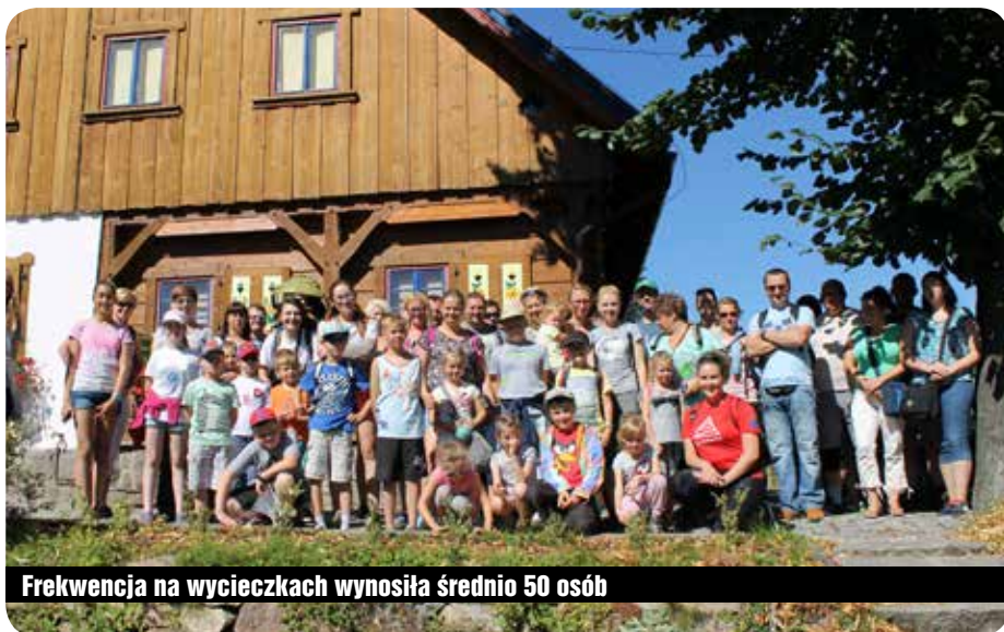
Frekwencja na wycieczkach wynosiła średnio 50 osób