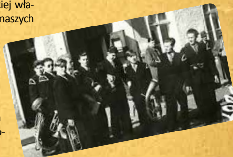
Orkiestra dęta domu dziecka Znicz – Karpacz, początek lat 50. XX w.